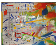
Artur Chaciej „Partytura” – obraz olejny Cena wywoławcza 1000 PLN