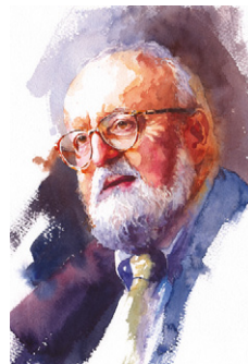
Andrzej Gosik Portret Mistrza II – akwarele Cena wywoławcza 1000 PLN

Obrazy Andrzeja Gosika z autografem Mistrza Pendereckiego zostały wykorzystane na okładce ostatnio nagranych płyt wydawnictwa DUX .