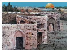
Jerzy Cichecki „7 bram Jerozolimy” Cena wywoławcza 450 PLN