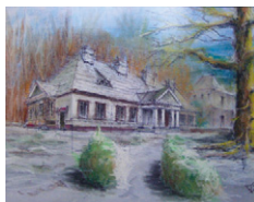
Antoni Filipowicz „Lustawice – Dwór “ – obraz olejny Cena wywoławcza 600 PLN